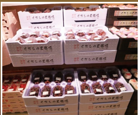
店舗ディスプレイ例

果物を傷めず、そのままディスプレイできます。 そのまま店舗でディスプレイでき、並び替えの手間も軽減できます。 桃・リンゴ・梨など国内外の長距離輸送でも安心！