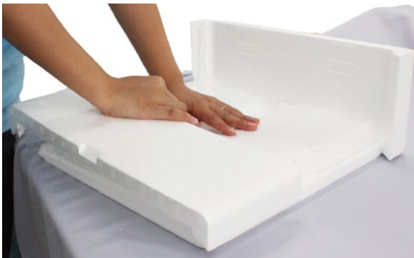
③長手の側面を折ります。