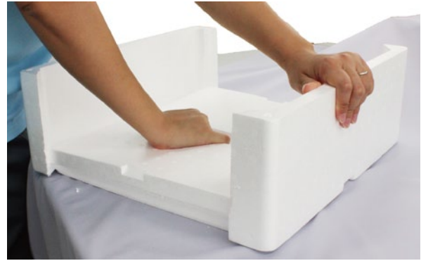
②もう片面の側面も折ります。