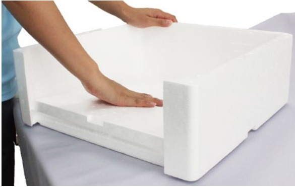
①短手の側面を折ります。