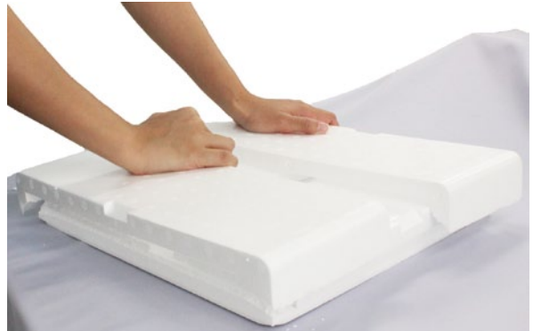
④もう片面の側面を折れば、 とってもコンパクト♪