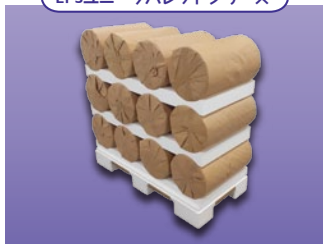
ロールホルダー パレット