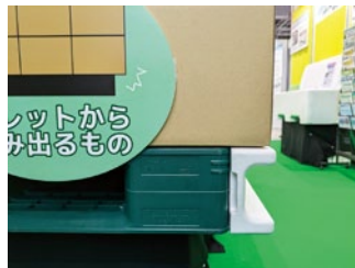
クラッシュストップ