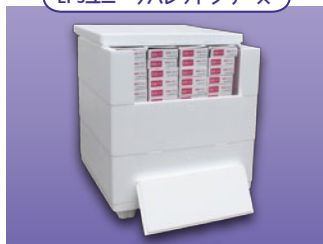
スマートクーリング コンテナ